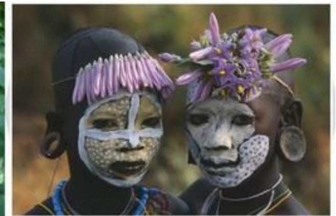
Buntheit, regnerischerStilch Auf den Fingern die gleichen Blüten, einmal gelblich, einmal wuchernd. Die Blätter bedeckt mit Platten aus von Haisen und Fels. Die Hauptfarbe heißt Natur. Die Färbung aus natürlichen Eisen und Lehm gewonnen.